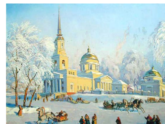
В. Белов. Собор Александра Невского. Масленица