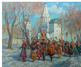
А. Брусилов Масленица. 1999