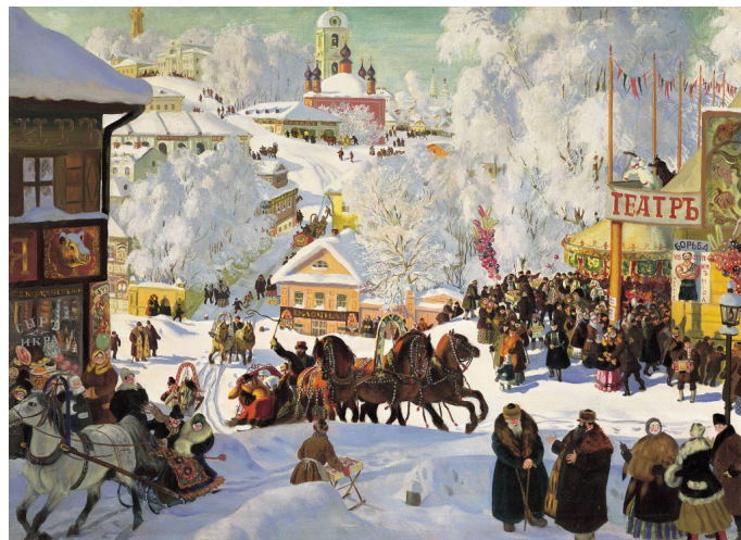
Б. Кустодиев. Масленица. 1919