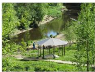
Родник и река Охта. Муринский парк

Происхождение гидронима следующее: «ohto» (карел.) – «косолапый», «топтыгин» - «Медвежья речка»; «охта» - финно-угор. – «река», «приток». Люди, жившие на реке Охте сеяли рожь, овёс, ячмень, лён; разводили коров, овец, коз; занимались рыболовством, ловлей раков, травосеянием, выделкой ивовой коры для кожевенных заводов. Жители Охты обеспечивали молочными продуктами петербуржцев. В поэме А.С. Пушкина «Евгений Онегин» мы читаем: