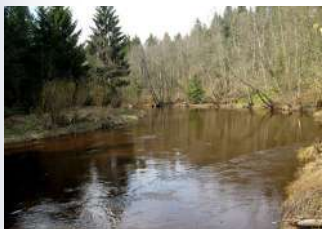
Начало реки Охты

По территории нашего Всеволожского района Ленинградской области и на северо-востоке Санкт-Петербурга протекает река Охта. Протяженность реки 99 км, это правый приток реки Невы. Река берет начало в районе Термоловских болот на Лемболовской возвышенности.