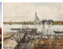
А.Н. Бенуа. Вид на реку Охту

Ребята, в нашем школьном музее разработана новая экскурсия «Памятные истории реки Охты в инфографике». Приходите!