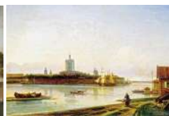
А.П. Боголюбов. Вид на Смольный монастырь