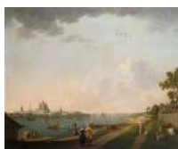
Б. Патерсен. Вид Смольного монастыря со стороны Охты