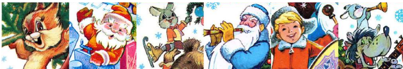
Персонажи из иллюстраций Владимира Ивановича Зарубина