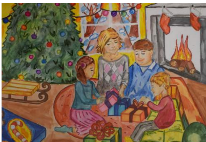
Попова Полина, 4 «Ж» класс «Новый год - семейный праздник»