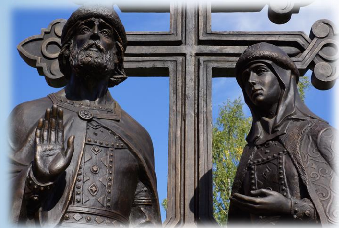
Памятник в Великом Новгороде