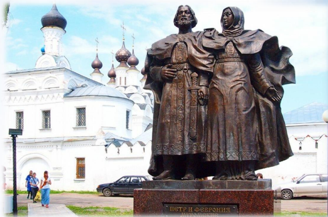
Памятник в Муроме – на родине святых

Вопрос. Как передали скульпторы образы Петра и Февронии? Какие художественные приемы здесь использованы?