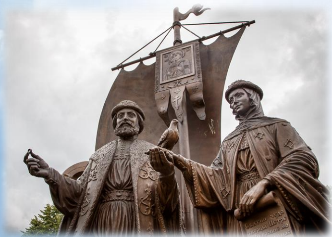
Памятник в Екатеринбурге